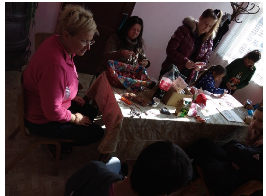
Отбелязване на великденските празници и традиционен събор на с. Скалско