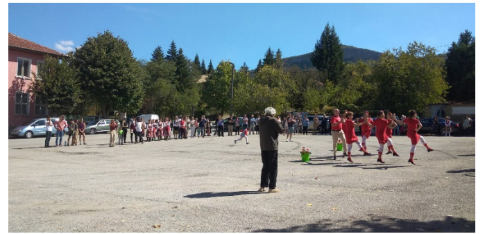
Сформираната танцова формация „Светлина“