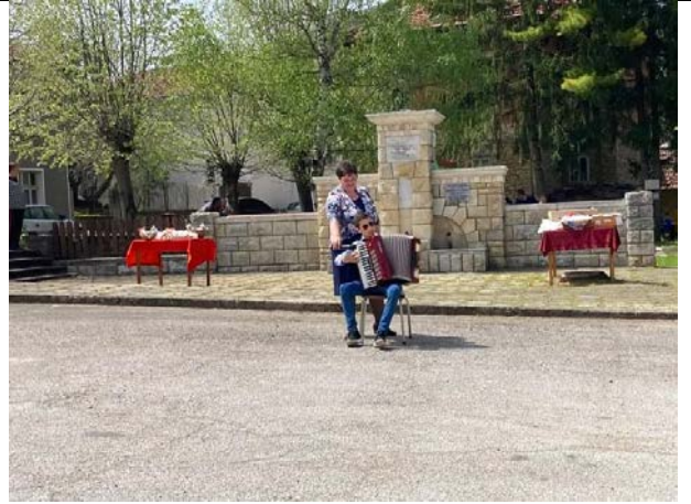
Концерт на Нов Симфоничен оркестър в с. Скалко