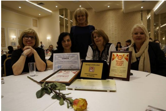
Читалището е носител на

С доклада отчитаме година на добре свършена работа от екипа на читалището и Настоятелство. Доказателство за това са и спечелените национални награди. За втора поредна година Читалището ни е носител на :