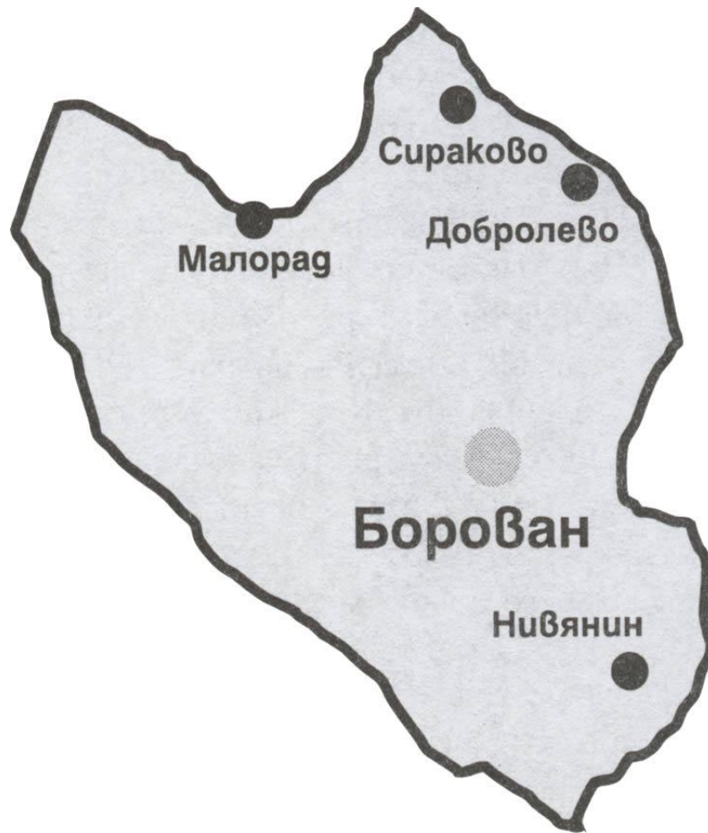
КАРТА НА ОБЩИНАТА