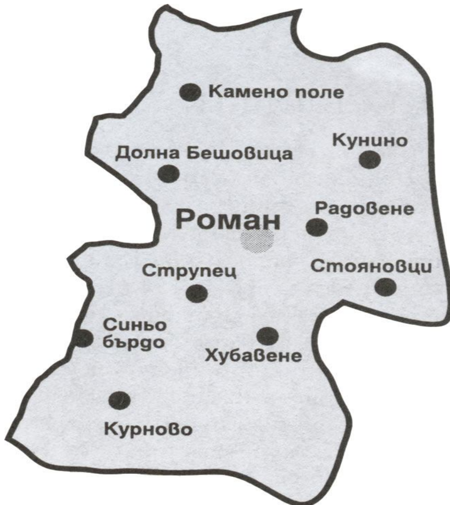
КАРТА НА ОБЩИНАТА