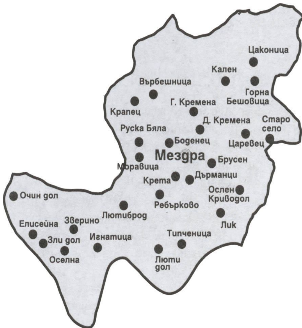
КАРТА НА ОБЩИНАТА