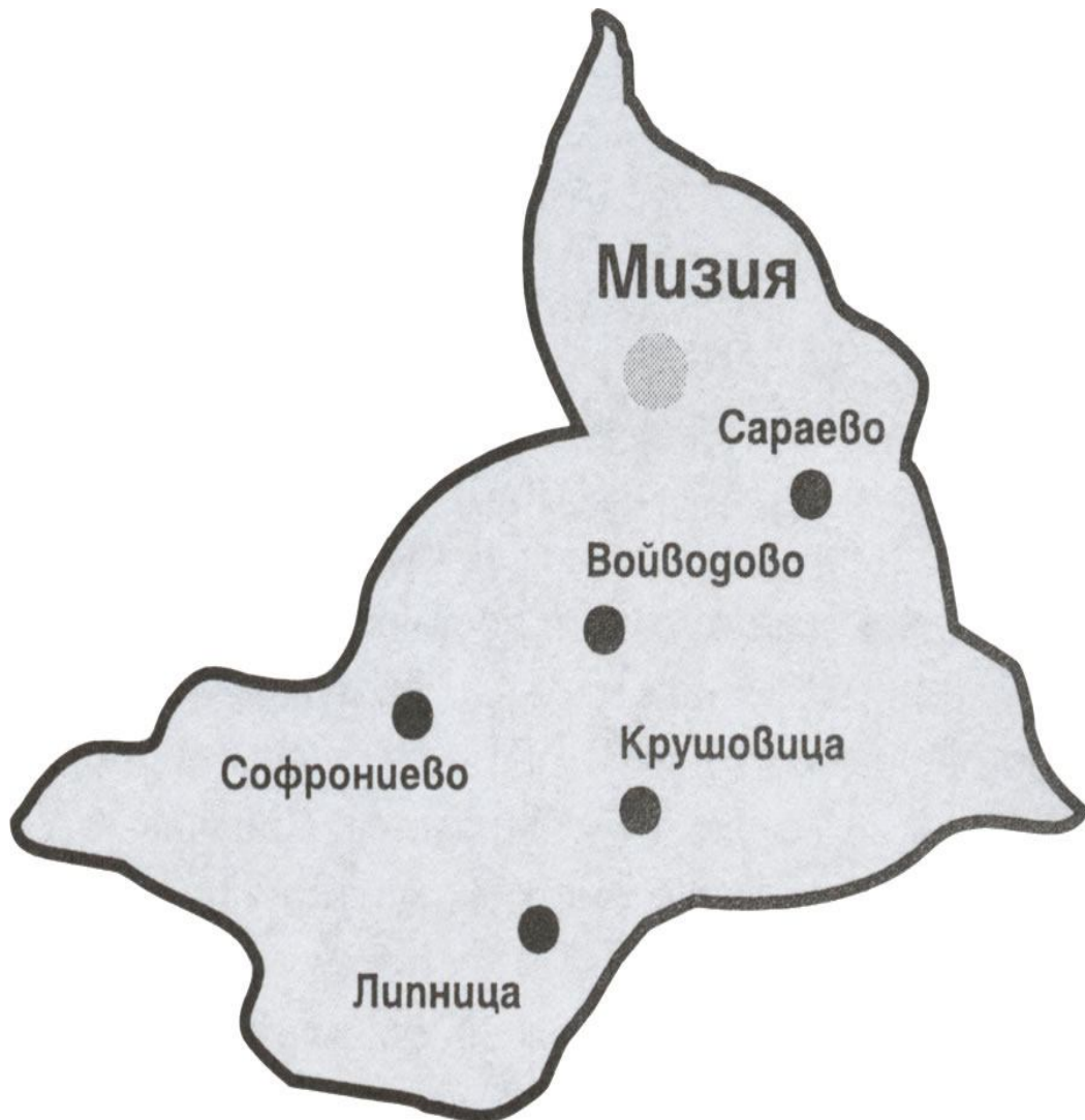
КАРТА НА ОБЩИНАТА