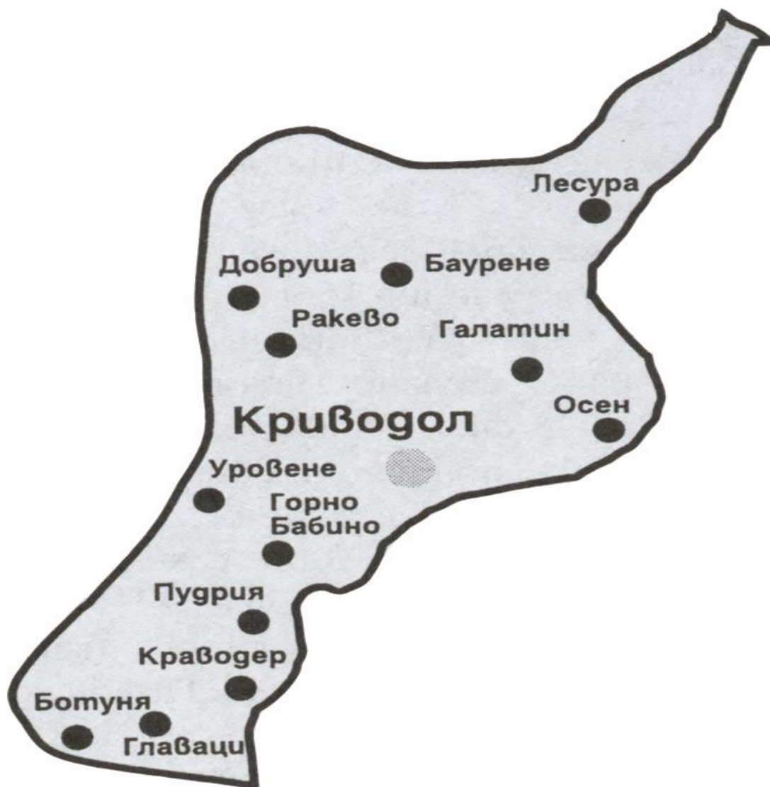
КАРТА НА ОБЩИНАТА