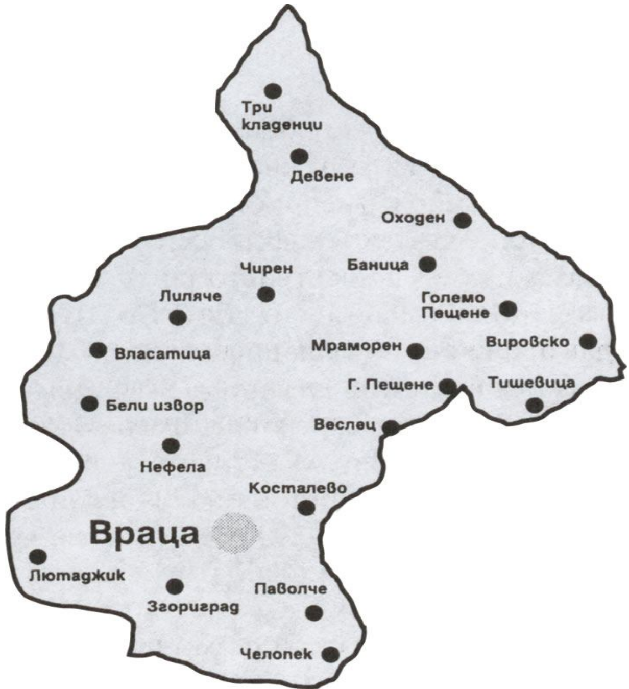
КАРТА НА ОБЩИНАТА