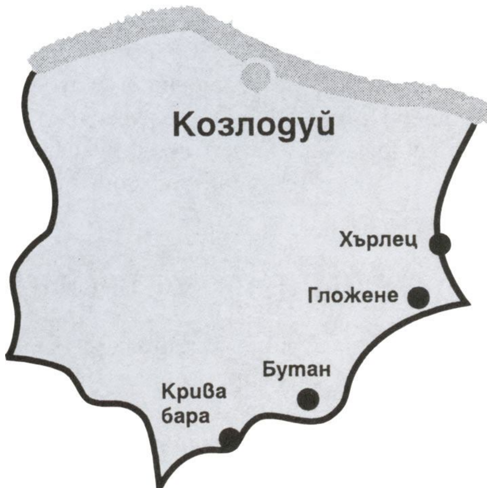
КАРТА НА ОБЩИНАТА