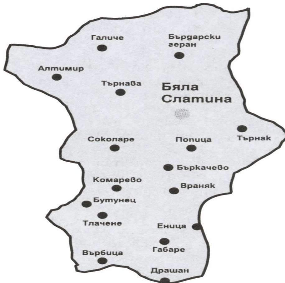
КАРТА НА ОБЩИНАТА